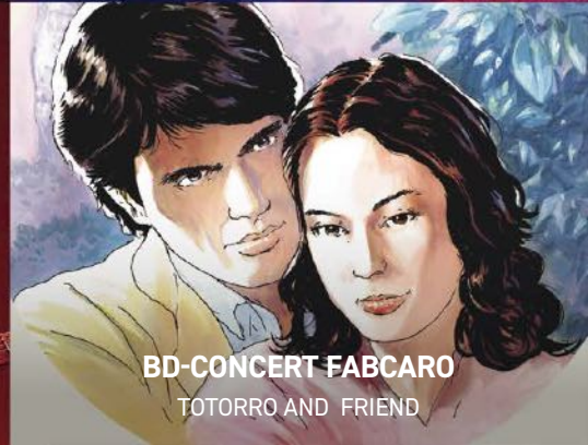
BD-CONCERT FABCARO TOTORRO AND FRIEND