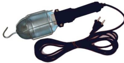
3 portable lights