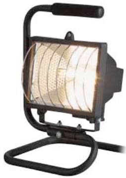
3 portable scene lights