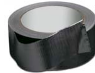
1 american tape